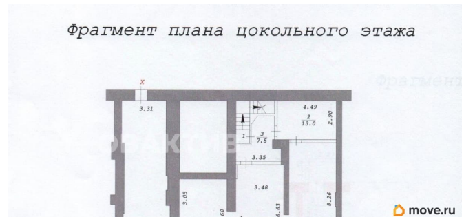
Фрагмент плана цокольного этажа