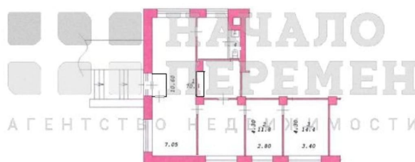
ПЛАН ПОМЕЩЕНИЯ М 1: 200